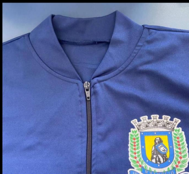
Acabamento da gola redonda