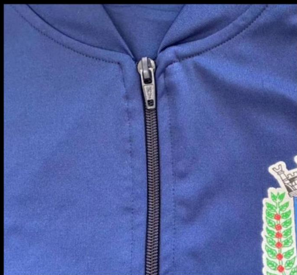
Detalhe do acabamento do zíper