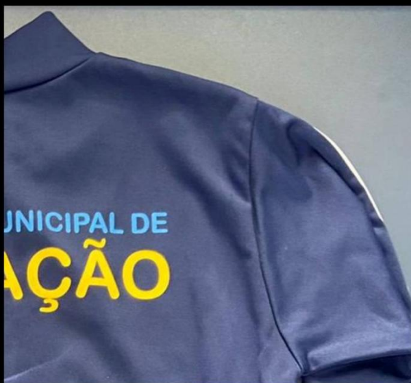
Detalhe da manga