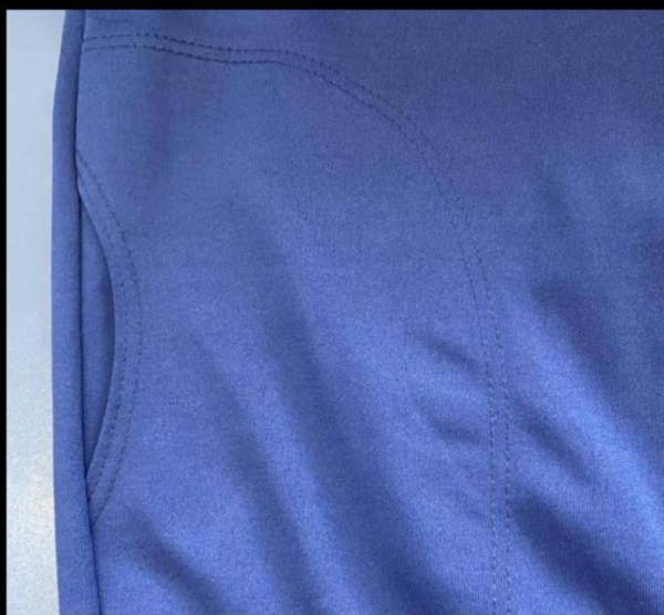
Detalhe do pesponto do bolso